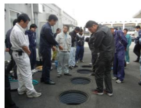
現場研修会(H27.11.11)三豊市

オ 善通寺市より、浄化槽台帳の整備事業を受託し、浄化槽台帳の管理等を行った。調査348基の内190基が休廃止となった。また、受検推進158基の内21基の受検承諾があった。