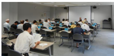
三豊市文化会館マリソウエーブ(H27.8.27)