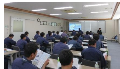
検査職員研修 (H27.5. 26) 協会会議室

検査の信頼性確保のため、水質検査のpH等4項目について内部精度管理を実施するとともに、香川県計量協会主催の分析講習会等外部精度管理事業に参加した。また、検査職員の知識と技能を高めるため、定期的に職員研修を実施した。