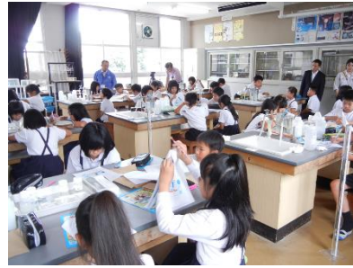
高松市立下笠居小学校 (H27.7.10)