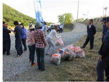
環境美化活動(H27.6.4)香東川左岸