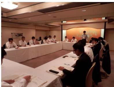
四国地区協議会浄化槽検査員研修会 (H27.9.10~11) 高知県