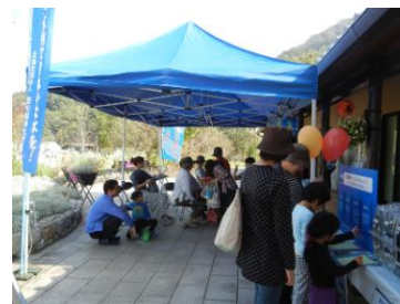
善通寺農商工フェスタ 2015 (H27.10.24~25)