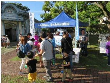
夕ぐれコンサート (H27.6.6 高松市)

高松市上下水道局主催の「夕ぐれコンサート(高松市)」、「みとよ健康・福祉まつり」及び「善通寺農商工フェスタ2015」に加え本年新たに三豊市水処理課と連携し、「三豊発! さぬき軽トラ市」にも参加し、浄化槽の展示など広報啓発活動を行った。