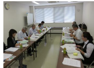
一般財団法人長崎県浄化槽協会業務視察(H27.8.4~5)