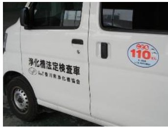
こども 110 ばん

成 24 年 10 月に、全浄連四国地区 5 団体と「災害時における相互応援協定」を締結し、東南海・南海地震等の大災害に備えた。