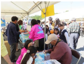
みとよ健康・福祉まつり (H27.10.17)