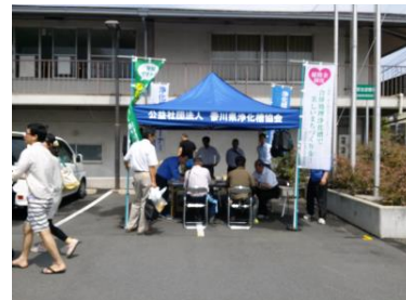
三豊発! さぬき軽トラ市 (H27.5.31 三豊市)