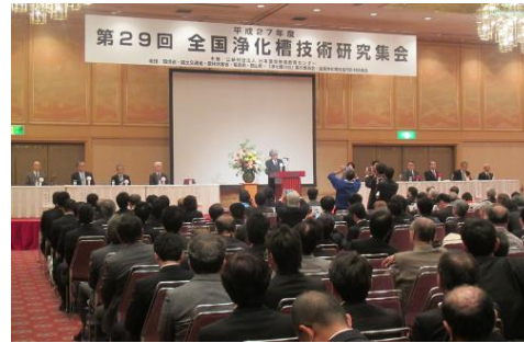
全国浄化槽技術研究集会 (H27.10.14~15)福島県