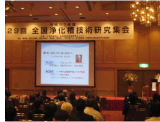
全国浄化槽技術研究集会 (H27.10.14~15) 福島県